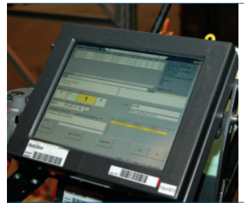
Zusätzliche operative Sicherheit durch Automatisierung.