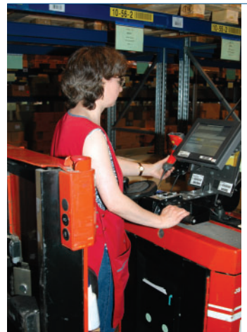
Mitarbeiter schätzen die praxisnahen Datenfunkdialoge.