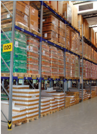
Prozessintegrierte und mandantenspezifische Erfassung von Leistungen.